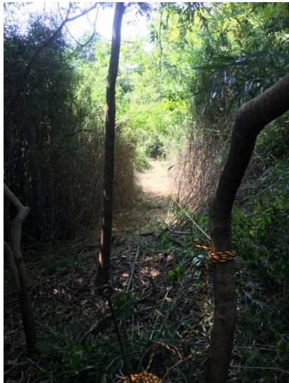
竹藪を切り開いた平面路