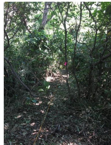
クヌギの林の玉切(幹)材を集める