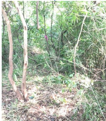
クスノキからの斜面路