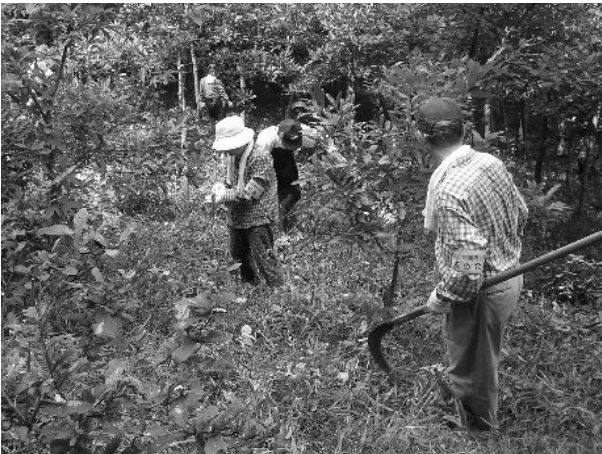
池ノ上の草刈で見通しがよくなりました