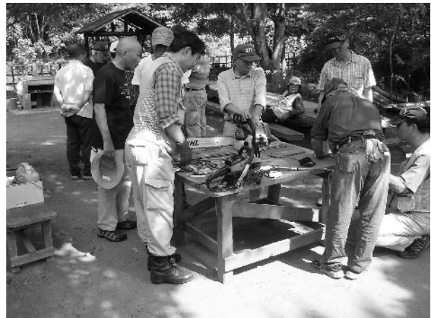
チェーンソーの分解手入れの勉強会