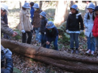
円海山そばのガールスカウトの森にて、ガールスカウトの間伐作業体験のお手伝いをしました